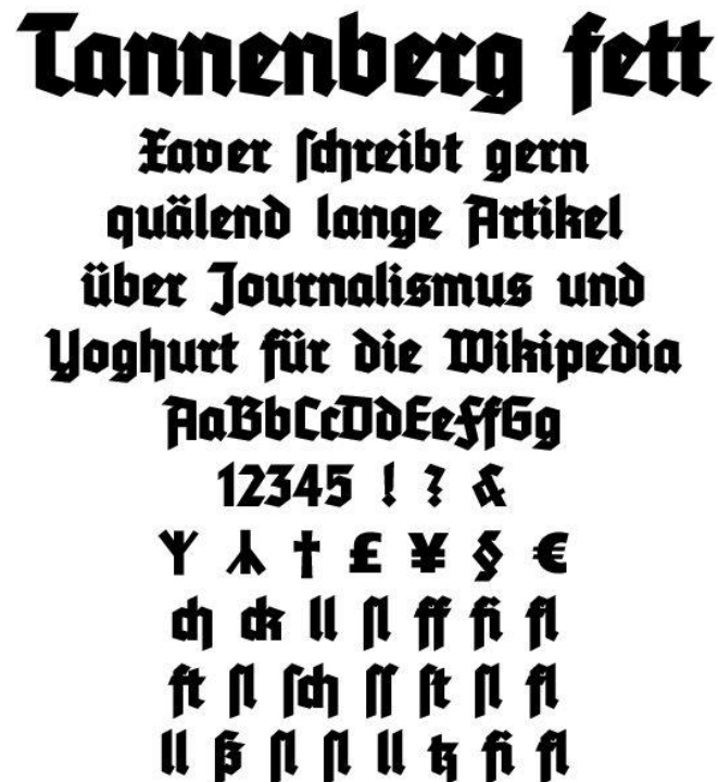
Abbildung 2: Tannenberg fett

Ein Beispiel für die Schrift „Tannenberg“ zeigt folgende Abbildung (Abbildung 2; nächste Seite).